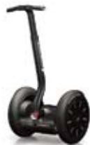
i2 基本モデル 935,000円