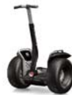
x2 芝用モデル 1,005,000円

※ 価格はすべて税抜きです。 ※ 別途保険料が必要です。 ※ 写真はイメージです。実物とは異なる場合があります。